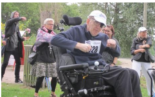
Denne gang også med boksning ...