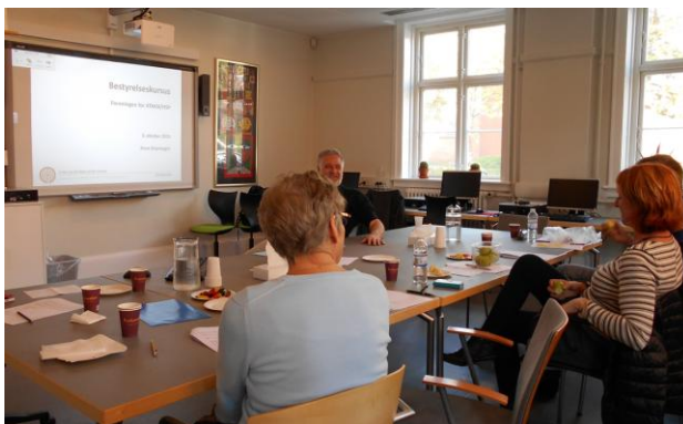
Kursusdeltagere i snak med instruktøren