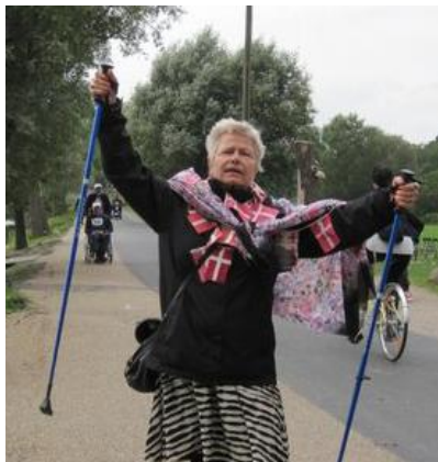
Fødselaren i mål ...