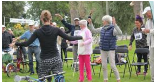
og opvarmning ...