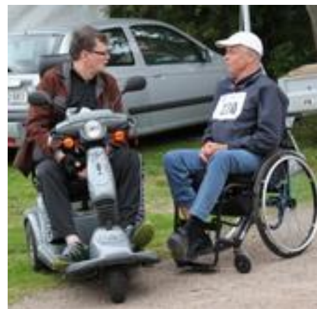
Verdenssituationen ordnes ....