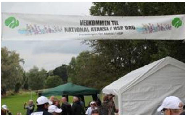
Så er der registrering ...

Arrangementet foregik i tørvejr ☺ og højt humør. Et fødselsdagsselskab var med til at gøre dagen ekstra festlig.