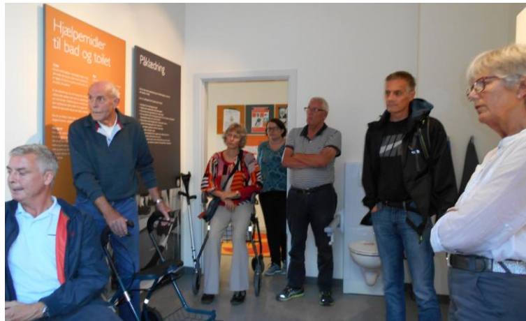
Demonstration af et badeværelse