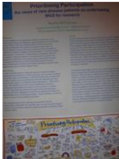
Patientinddragelse - En af de mange plakater fra udstillingen

I kan læse om projekterne på www.rd-connect.eu (hvor der også ligger en video) og www.rd-neuromics.eu (som bl.a. fortæller om 100 nye sygdomsgener, som projektet har fundet).