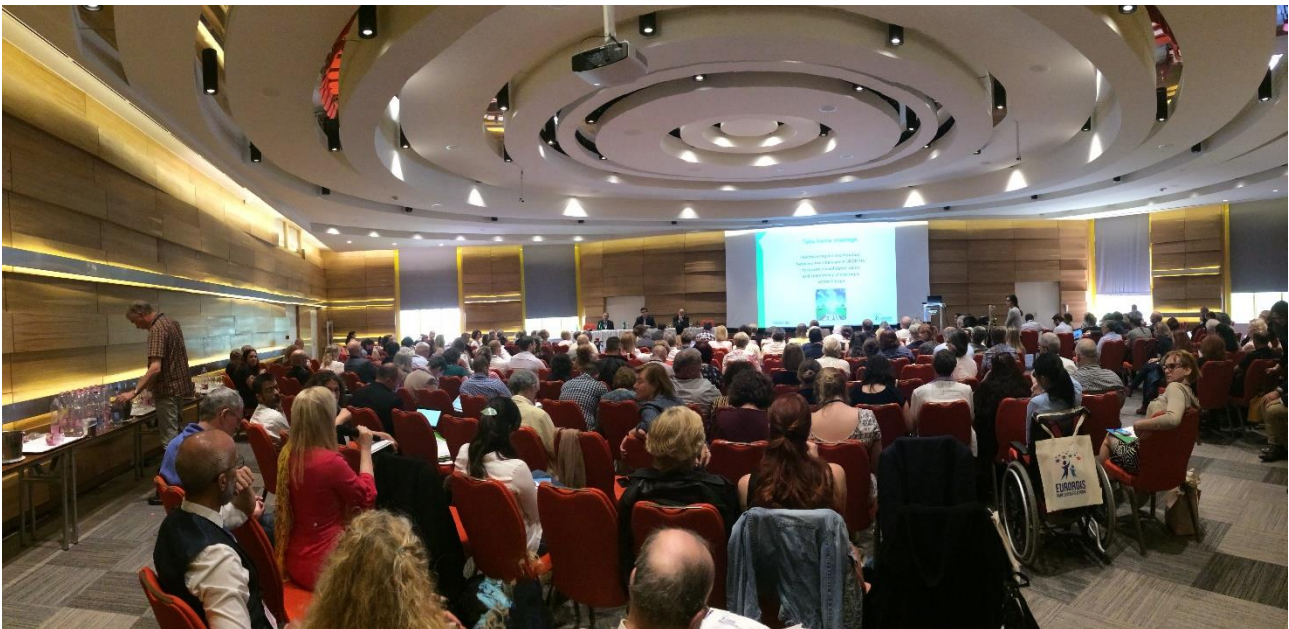
Et kig ud over de mange deltagere